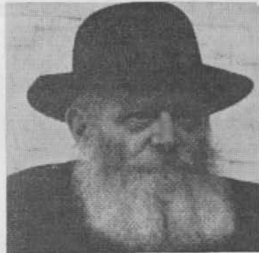
Menachem Mendel Schneersohn – snart 90 år.

I et interview i Jewish Chronicle i november 1990 forklarer en af Schneersohns talsmænd grunden til, at Habad-bevægelsens leder ikke har sat sin fod i Israel. Det hænger sammen med, at hvis Schneersohn kom til Israel, ville han ikke være i stand til at forlade Israel igen. Ganske vist har Maimonides, den store jødiske autoritet i Middelalderen, givet nogle dispensationer for dem, der bor i Israel. Ifølge Maimonides må man forlade Israel for at studere Toraen eller for at gifte sig. Men Schneersohn ser ud til at være af den opfattelse, at er man først i Israel, er det ifølge jødisk religiøs lov meget problematisk at forlade