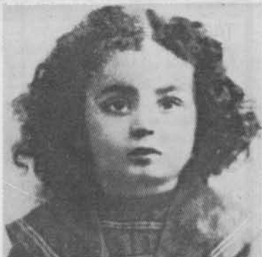
Menachem Mendel Schneersohn som 3-årig.

Menachem Mendel Schneersohn har dog aldrig besøgt Israel, og efter signende har han i den lange periode, han har ledet Habad-bevægelsen, aldrig bevæget sig uden for Brooklyn.